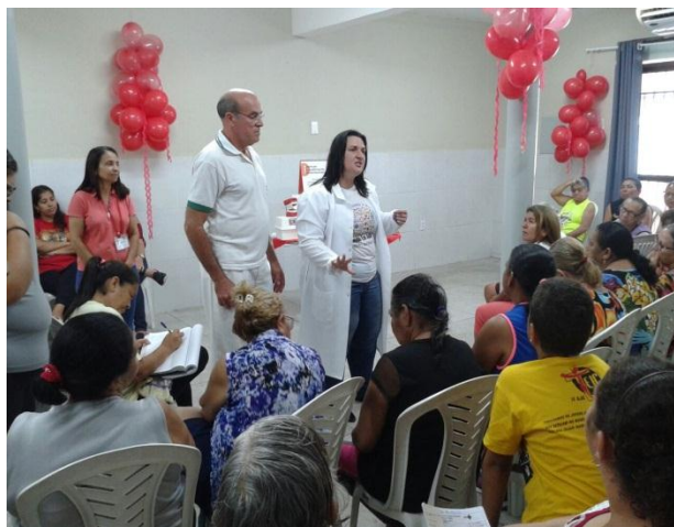
Momento Realizado no CRAS

PSF Aprovada pelo Senado, a Lei 13.504 institui a Campanha Nacional de Prevenção ao HIV/Aids e outras infecções sexualmente transmissíveis (Dezembro Vermelho). A campanha tem foco na prevenção, assistência, proteção e promoção dos direitos humanos das pessoas que vivem com HIV/Aids. Ao longo do mês de dezembro, são realizadas atividades e mobilizações tais como iluminação de prédios públicos com luzes na cor vermelha; veiculação de campanhas de mídia; palestras e atividades educativas; e promoção de eventos. As ações do Dezembro Vermelho são realizadas em parcerias entre o poder público, sociedade civil e organismos internacionais, de acordo com as diretrizes do Sistema Único de Saúde (SUS) para enfrentamento da Aids e outras ISTs. No Bairro da Ilha do Bispo, esta ação se deu em parceria com a Rede Amiga da Comunidade. Foram realizados palestras e testes rápidos (HIV, Sífilis e Hepatites) com a comunidade. A gerente da Unidade Integrada de saúde da Família da Ilha do Bispo lembrou que, estas são ações que reforçam os cuidado, prevenção e tratamento dessas doenças recorrentes no território, permitindo uma melhor qualidade de vida à população.