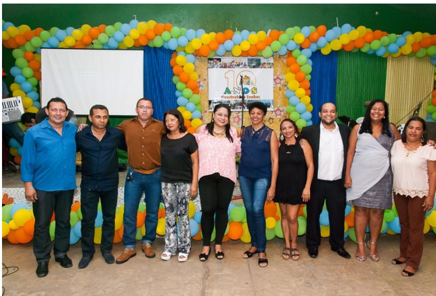
Coquetel em Comemoração aos 10 Anos da ARCA

fundação e atuação com a missão de contribuir para o desenvolvimento humano de pessoas socialmente vulneráveis através da atuação nas dimensões social, educacional e profissional, exercendo o controle social de políticas, públicas priorizando crianças, adolescentes e jovens numa perspectiva de fortalecimento de vínculos familiares e comunitários. Foram várias ações para celebrar esse momento, onde no dia 19 de Dezembro foi realizado um encontro com todos e todas que contribuíram com essa caminhada reunindo sócios, educadores, colaboradores, voluntários, parceiros, usuários e familiares para apresentação dos que foi construído durante esse período. A ARCA segue sua caminhada se fortalecendo no seu fazer e nos seus valores em busca do desenvolvimento social da grande João Pessoa.